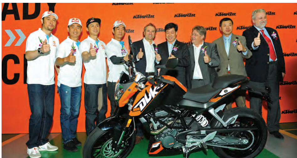
Z letom 2019 sta z izgradnjo nove tovarne še konkretnije združila moči kitajski CF Moto in KTM. V novi tovarni na Kitajskem s proizvodno zmogljivostjo 50.000 motociklov letno bodo izdelovali tudi modele KTM 790 Duke in 790 Adventure. In druge.