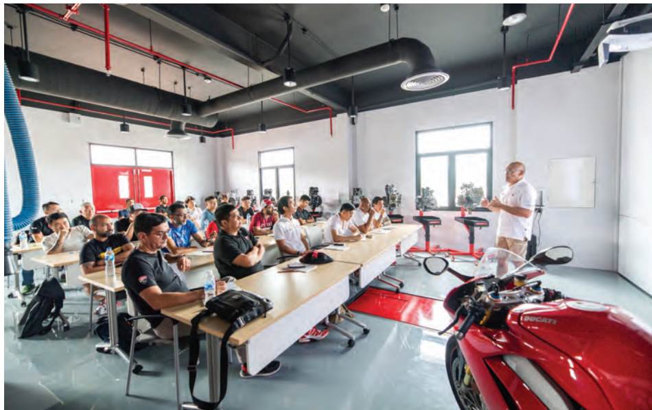
Ducatijev izobraževalni center na Tajskem

Ducati na Tajskem sestavlja praktično vse svoje modele, tudi model Panigale, vendar pa samo za dobavo azijskim trgom in nekaj tudi Severni Ameriki in Avstraliji. V Evropi tajskih Ducatijev menda ni. Model Srcambler je bil prvi, za katerega se je sicer govorilo, da bo v Evropo prihajal iz Tajske, vendar so v Bologni te govo-