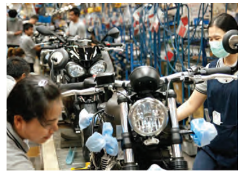
Honda je večino svoje proizvodnje linije motornih koles z manj kot 700 ccm preselila z Japonske na Tajsko. To povesta tudi prva dva znaka VIN številke – »ML«.

Evrope, ta pa je kot protiukrep močno obdavčila nekatere ameriške izdelke, tudi motocikle Harley-Davidson. Carine na njihove motorje so bile včasih šestodstotne, z uvedbo ukrepov pa so se zvišale na kar 31 odstotkov, kar naj bi ceno motociklov v Evropi po navedbah H-D-ja v povprečju zvišalo za 2.200 dolarjev! Vendar pa se je Harley-Davidson odločil, da ta strošek ne bo bremenil kupcev, pač pa bo proizvodnjo motociklov za evropski trg preselili na Tajsko (in v Indijo) in se s tem izognil visokim carinam.